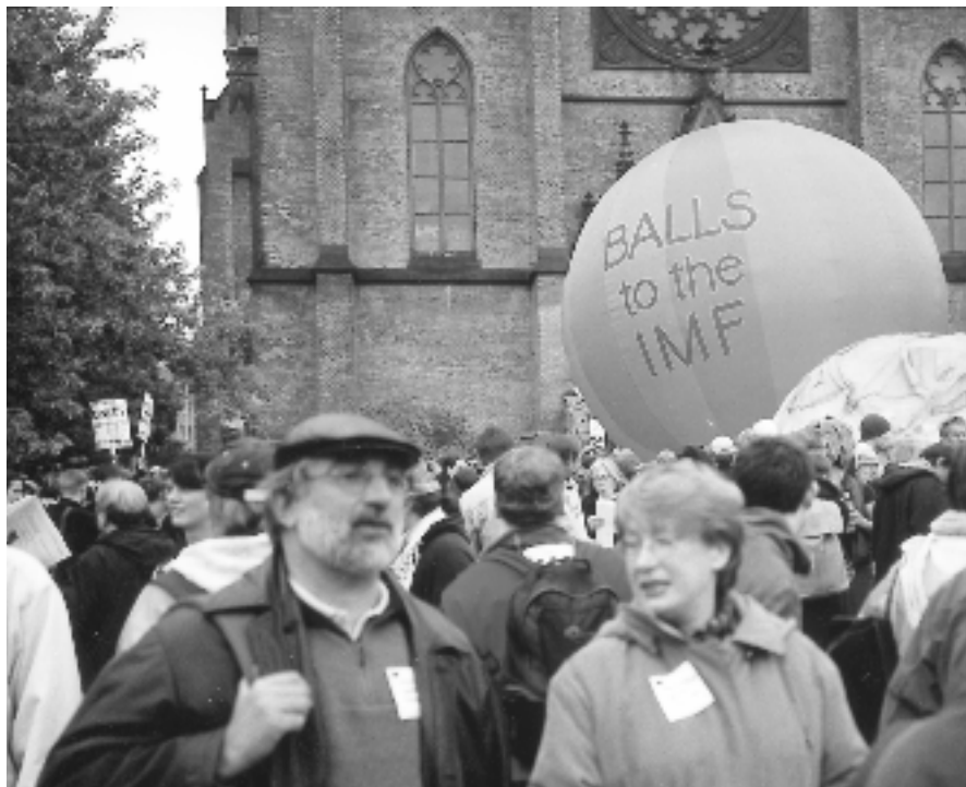
La question du rôle et de l'organisation du FMI est au cœur des initiatives pour une mondialisation de coopération.

lar sur le monde et son soutien des importations de capitaux aux États-Unis pourraient être dépassés par une prise inflationniste redistribuée en faveur de l'emploi ou de la formation partout et de capitaux coopérant pour le co-développement de tous les peuples