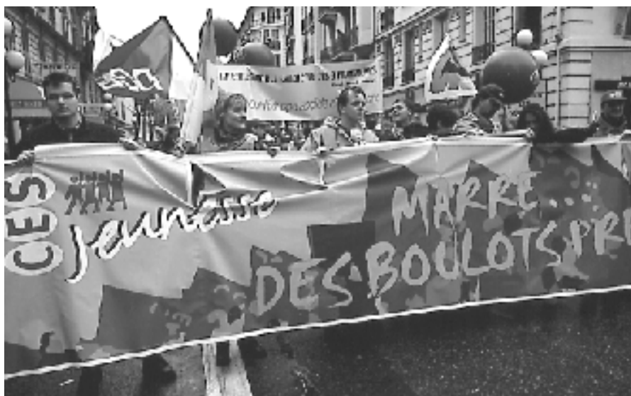
Une sécurité d'emploi et de formation permettrait une continuité de bons revenus et de droits pour tous, à l'opposé des situations de précarité et d'exclusion.

partageant les coûts informationnels et accaparant les marchés, d'autre part pour lever des capitaux pour les dépenses informationnelles nouvelles.