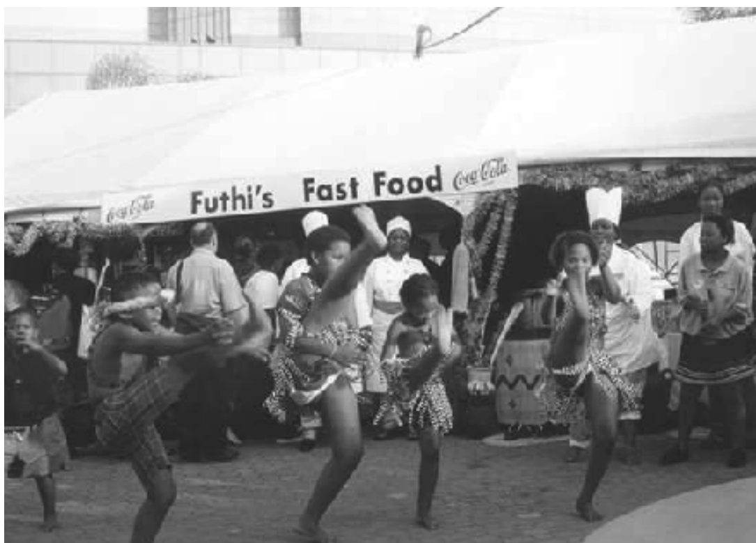
Il ne s'agit pas de vouloir faire le bien d'autrui de façon paternaliste, mais de favoriser la possibilité pour chacun de contribuer à son propre bien, dans une éthique d'intercréativité.

Ainsi, s'élaboreraient des triangles décentralisés entre propositions d'objectifs sociaux, moyens financiers et nouveaux pouvoirs (avec partage de droits d'interventions et d'information). Ces rencontres décentralisées locales s'articuleraient, d'une part, aux concertations des assemblées de travailleurs et des comités d'entreprises dans les établissements et entreprises de production ou de services, dont les pouvoirs seraient accrus. Elles s'articuleraient aussi à un niveau régional. Des concertations pourraient être organisées à des niveaux plus vastes dans des assemblées régio-