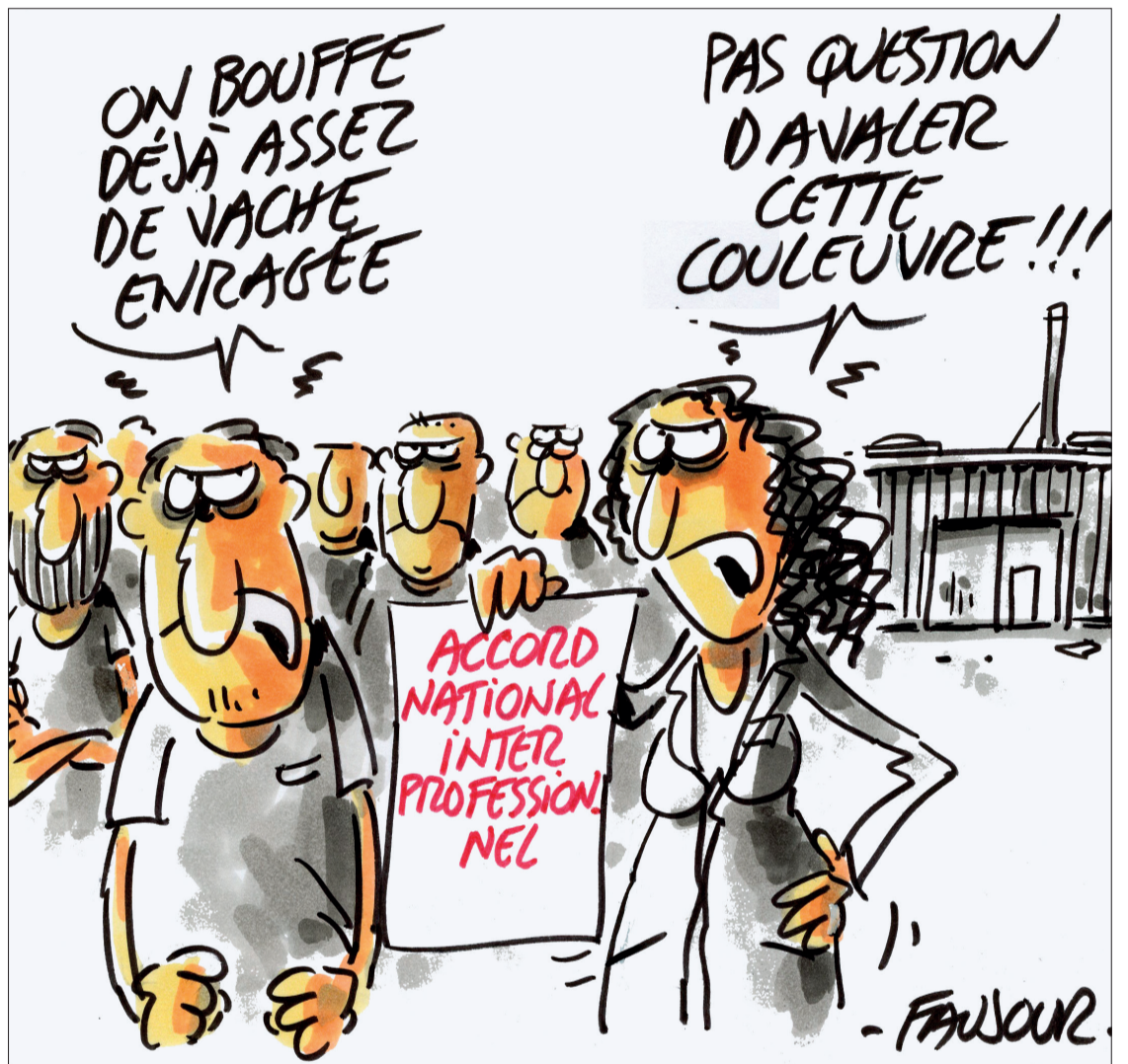
Bernard Thibault, secrétaire général de la CGT

Le 11 janvier 2013, les négociations nationales dites de « sécurisation de l'emploi » se sont terminées par un accord d'une extrême gravité pour les droits des salariés. La CGT et FO ont annoncé qu'elles ne le signeront pas. Par contre, la CFDT, la CGC et la CFTC ont décidé de le parapher. Un projet de loi doit être présenté au Conseil des ministres début mars, pour ensuite être voté au Parlement en mai.