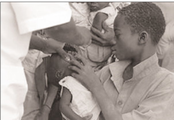
L'Afrique consacre quatre fois plus d'argent au remboursement de la dette qu'à la lutte contre le sida

Mais ces seuls chiffres ne décrivent pas l'ensemble des problèmes. Il faudrait aussi parler des frais de promotion probablement aussi élevés. Et surtout faire la différence entre les profits financiers et le financement nécessaire des recherches à venir. Cette course au profit financier se traduit dans les pays développés par des restructurations où on ferme des centres de recherche et de production pour se concentrer sur les seuls médicaments où le taux de profit sera maximal, tandis que d'autres sont abandonnés au mépris des malades et plus particulièrement des malades des pays les plus pauvres.