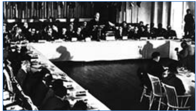
Réunion de Bretton-Woods en 1944.

Le plan White continue de subir des modifications, et il est discuté par les Américains avec plusieurs autres pays. À la fin de juin, Keynes rédige une synthèse des deux plans ; il y concède aux Américains le principe des souscriptions, la limitation de la responsabilité des créanciers, le fait qu'aucun pays ne puisse être forcé de changer la