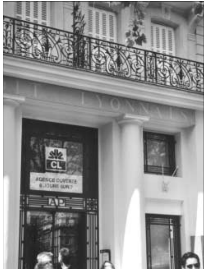
Pour une nouvelle mobilisation du crédit des banques...

Si l'on tient compte de ce qu'il est simultanément entré, cela donne tout de même une sortie nette de capitaux de 645 milliards de francs l'an dernier contre 500 milliards de francs en 1999 et 380 en 1998.