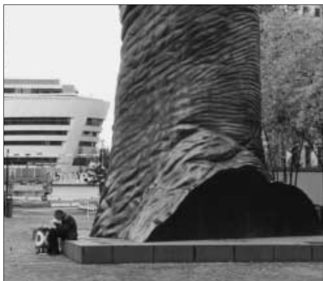
Augmenter le RMI et les minima sociaux.

Cela a beaucoup encouragé la précarisation des emplois et tiré vers le bas tous les salaires. La proportion des emplois à basse qualification et bas salaires est remontée en France en contradiction avec les exigences des nouvelles technologies.